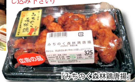
「みちのく森林鶏唐揚」

惣菜売場では、鮮魚や精肉部門で販売するものと同じ原料を惣菜部門で調理した商品を展開。「宮崎県産日南鶏やきとり」をはじめ、「みちのく森林鶏唐揚」などのミートデリ、「子持ちかれいの煮付け」などのフィッシュデリを品揃えする。(…続きは年間購読にお申し込み下さい)