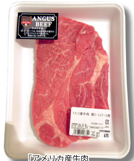
「アメリカ産牛肉 肩ロースステーキ用」

西友は生鮮食品の品揃え強化策の一環として、アメリカ産アンガスビーフの「肩ロースステーキ」を9月7日（水）から、全国342店舗と「SEIYU ドットコム」にて、187円/100g（税抜）で発売する。