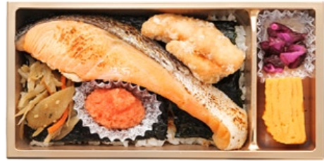
〈佃浅〉大森下町のり弁当 明太子入り 1,474 円 不動の人気、大森下町のり弁当に明太子が入ってさらにパワーアップした。