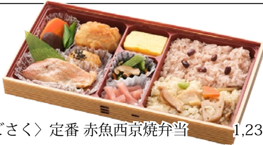
〈たごさく〉定番 赤魚西京焼弁当 1,230 円 赤魚西京焼をメインに唐揚げ肉団子、煮物など人気の惣菜を楽しめる弁当。