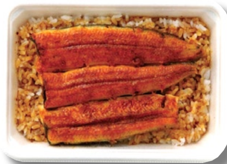
〈銀座鳴門〉うなぎ弁当 3,726 円 国産うなぎを店頭で丁寧に焼き上げ、ふっくら仕上げた自慢の一品。