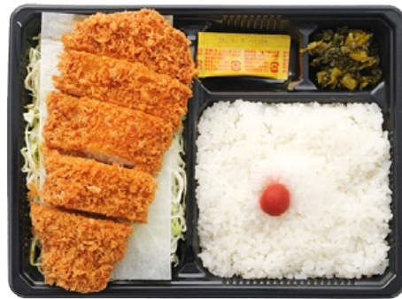
〈井泉本店〉 ロースカツ弁当 1,121 円 自慢のロースカツ弁当。