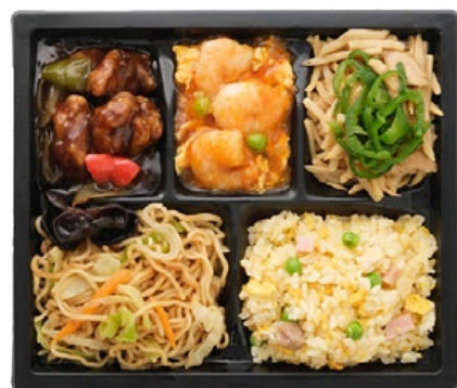
〈赤坂飯店〉 ハーフ&ハーフ弁当 940 円 おかずもごはんも選べる中華弁当。