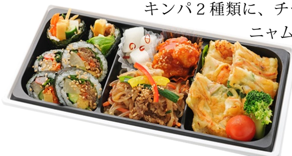
〈韓美膳デリ〉2種キンパの彩り膳 1,080 円 キンパ2種類に、チヂミやヤンニャムチキンなどの人気のおかずを集めた。