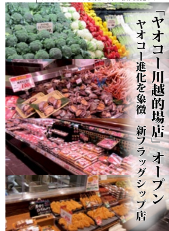
「ヤオコー川越的場店」オープン ヤオコー進化を象徴 新フラッグシップ店

東北エリアを見ていると、3.11 大震災以降の購買 行動が変わってきたように見える。一つは高齢化、年 金、社会保障に関する不安から、1円でも安くという 節約志向にある。もう一方では、同じ買い物をするの であれば、商品を吟味して安全